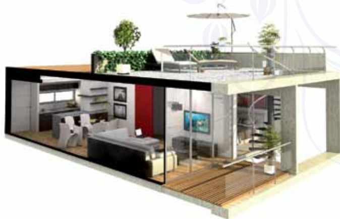
Dos ambientes con terraza

El proyecto, a partir del particular diseño que presenta, busca transmitir una sensación de calma, apertura y privacidad. Se trata de una oportunidad para volver a conectarnos con un entorno natural y a la vez con la identidad propia de una ciudad como Federación. Desde el desarrollo residencial y con un diseño de vanguardia, se ofrecerán unidades de uno, dos y tres dormitorios; de primer nivel y con vistas panorámicas. Los propietarios podrán acceder al gran conjunto de servicios, y disfrutar de las terrazas y de los balcones al lago; del sector de parrillas; de la piscina con solárium; del gym; del microcine; del laundry; y de las 47 cocheras subterráneas con bauleras. Finalmente, sobre el primer nivel, se dispondrán los locales comerciales, que complementarán de esta manera el espacio cotidiano y natural del área residencial con la comodidad de contar con un complejo comercial en casa.