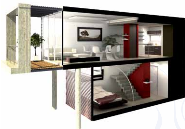
Dos ambientes en dúplex