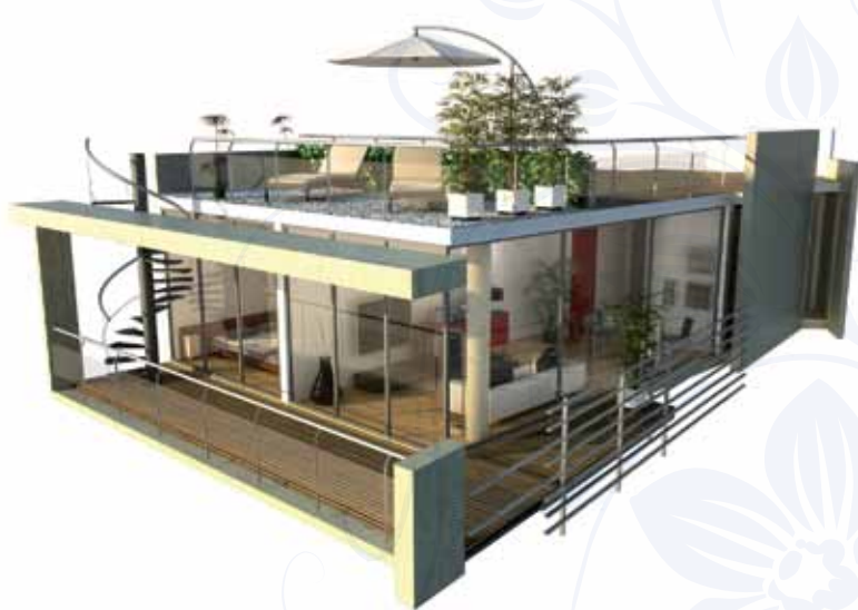
Tres ambientes con terraza

Un lugar con estilo y confort para disfrutar de la naturaleza